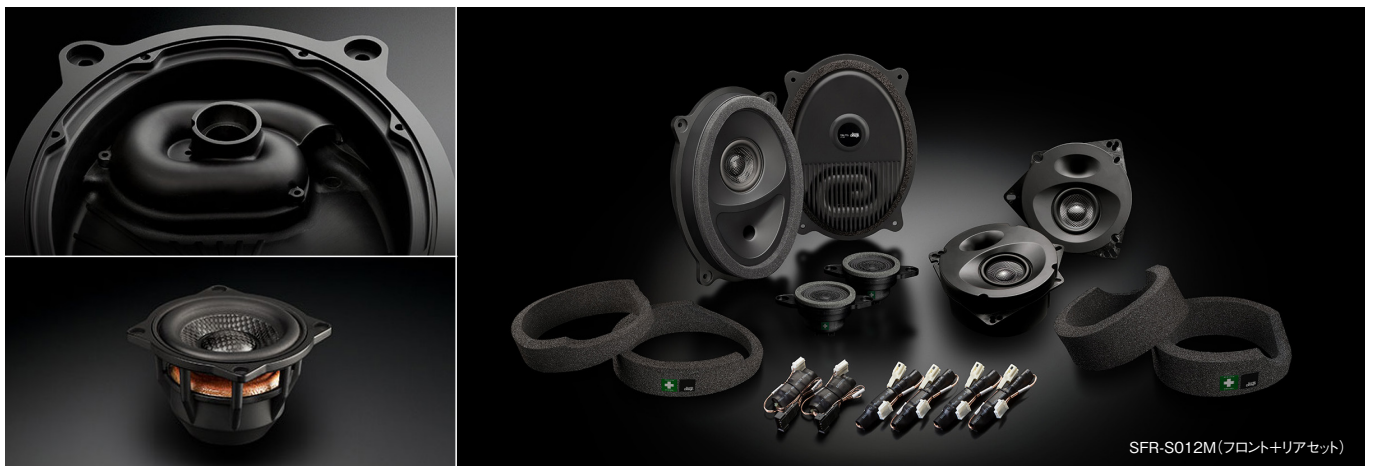
SFR-S012M(フロント+リアセット)

この製品には、ソニックデザイン独自の音響解析・補正ノウハウを結集してオーディオシステムの再生環境を改善するAcoustic Control(アコースティックコントロール)技術を採用しています。